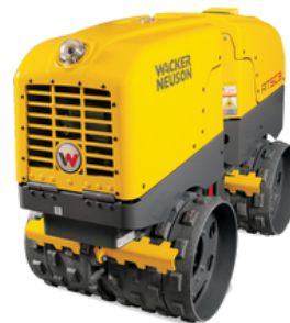
RTX-SC3 (controle remoto)