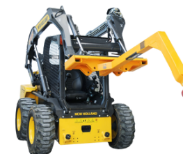
LANÇA DE MANOBRA